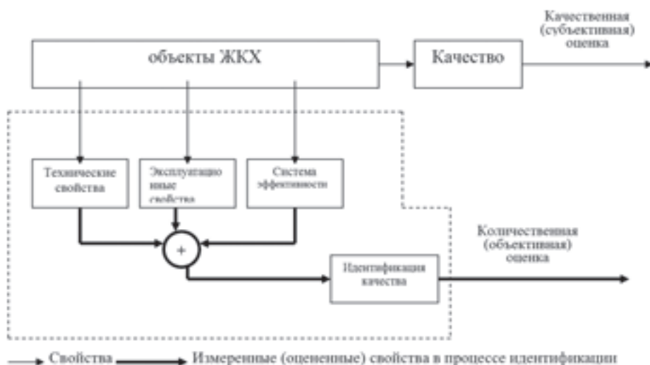
Рис. 2. Функциональная схема, отображающая понятие идентифицированного качества

В соответствии с основными свойствами объектов ЖКХ, их качество оценивают различными показателями: единичными (для характеристики частного качества); определяю-