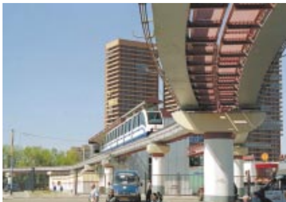
Московская монорельсовая транспортная система. Станция «Тимирязевская»

Год назад создан холдинг с головной организацией группа компаний «Трансстрой», на которую возложена выработка общей стратегии входящих в нее организаций, в первую очередь, маркетинг подрядных рынков. Сама структура возникла не на пустом месте. Еще с момента образования в 1991 г. в корпорации «Трансстрой» велась постоянная работа, направленная на укрепление наших позиций в транспортном строительстве, обновление и развитие производственных мощностей, наращивание научно-технического потенциала, повышение квалификации кадров.