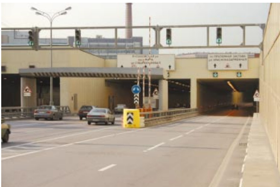
Третье транспортное кольцо Москвы. Въезд в Лефортовский тоннель

гостей опыт специалистов и тесные связи с организациями транспортного строительства, группе компаний удалось занять достойное место на строительном рынке и добиться заметных результатов.