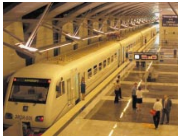
Станция подземного пассажирского железнодорожного терминала «Айропорт Внуково»

В состав холдинга вошли дочерние организации, ориентирующиеся на отдельные виды строительного бизнеса. Ведущими из них стали реструктурированные корпорация «Трансстрой» и инжиниринговая кор-