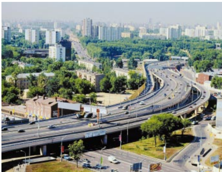
Третье транспортное кольцо. Тульские эстакады

Авторитет холдинга постоянно растет. В конкурентной борьбе, опираясь на бо-