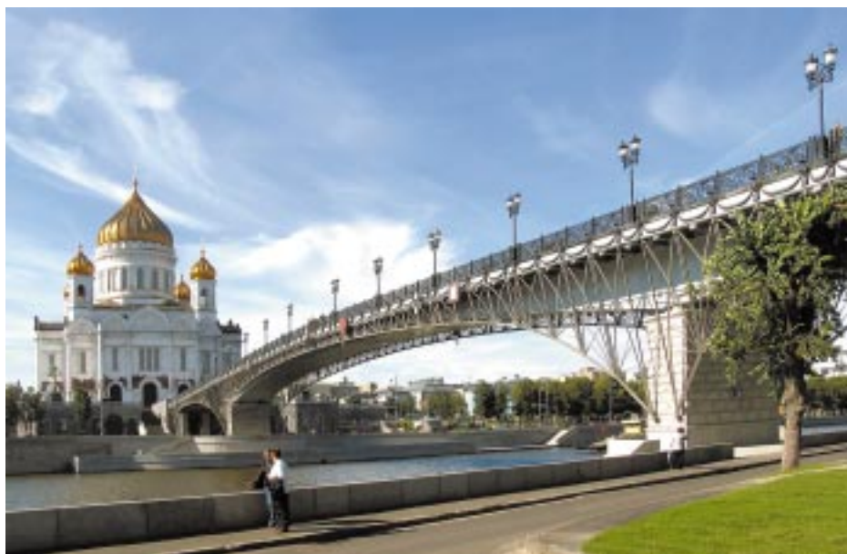
Пешеходный мост у Храма Христа Спасителя

деятельности, усиление конкурентоспособности на подрядном рынке, обеспечение высокого уровня мотивации работников. Направленно стимулируется поиск резервов экономии, в основном, за счет совершенствования технологий, применения новейших конструкций и материалов, сокращения сроков строительства, затрат на обслуживание производства. При этом одним из основных требований остается безупречное качество на уровне европейских стандартов, для чего подразделения оснащаются современными средствами контроля качества материалов и конструкций. Также усиливаем внимание к культуре производства и организации труда. На крупных и сложных объектах организуется научно-техническое сопровождение строительства, что также дает заметное повышение качества. Большое внимание уделяется обновлению корпоративной нормативной базы транспортного строительства.